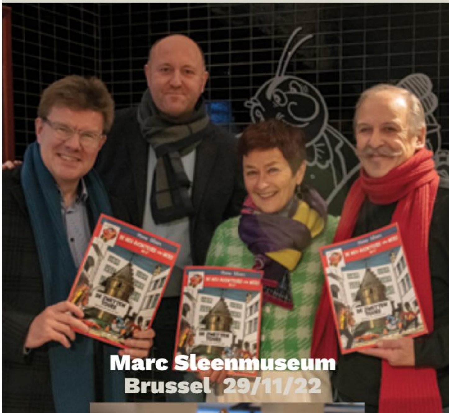
Marc Sleenmuseum Brussel 29/11/22